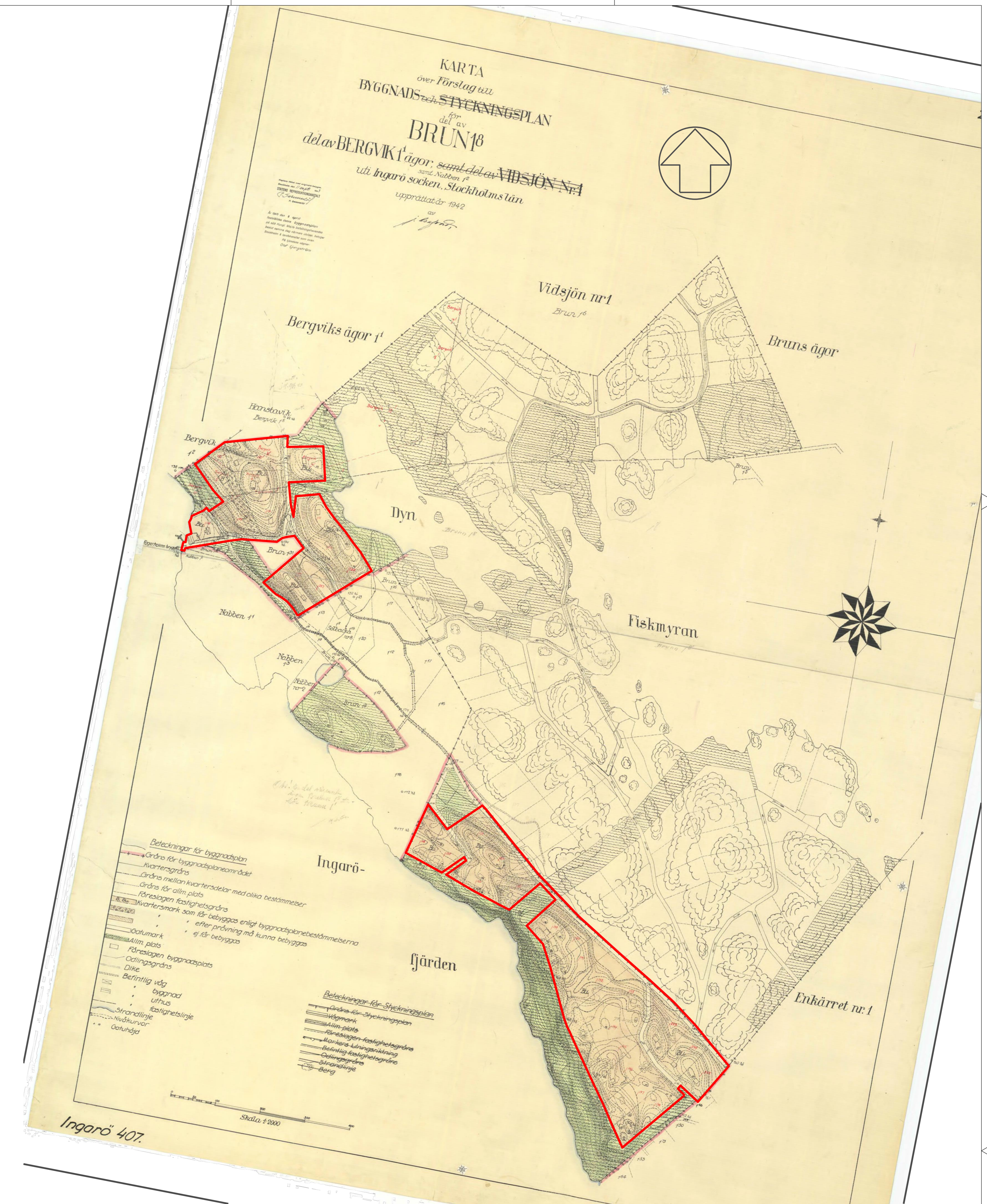
Del av byggnadsplan 5, plankarta med grundkarta södra delen