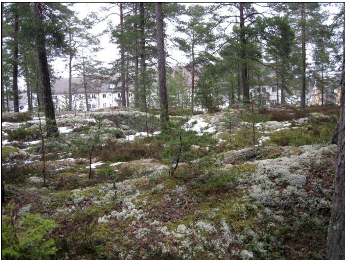
Del av området.