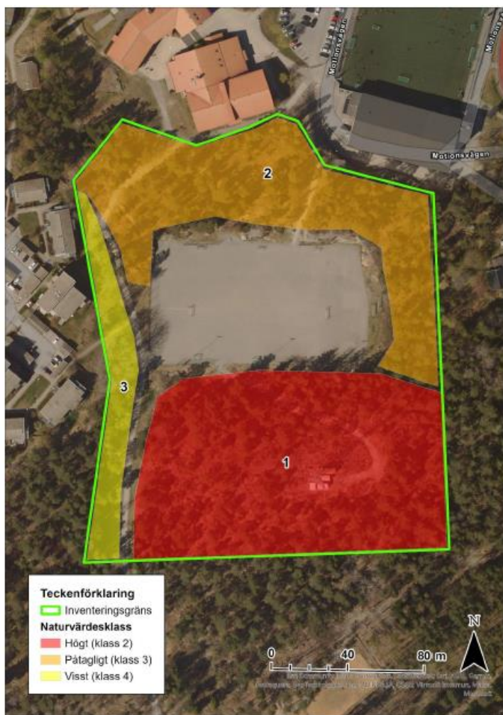
Figur 1. Kartbild över inventeringsområdet med avgränsade naturvärdesobjekt färglagda efter bedömt naturvärde enligt klassningen i SIS-standarden. 1= Högsta, 2= Högt, 3= Påtagligt, 4=Visst. Övriga ytor inom inventeringsgränserna som ej färglagts har lågt naturvärde. Observera att det inom objekt 1 finns en ianspråktagen yta för befintlig mast och väg.

Inom området identifierades tre naturvärdesobjekt. Den gamla hällmarksskogen bedöms ha högt naturvärde (klass 2). Där finns flera värdefulla biotopkvaliteter som gamla träd och god tillgång på död ved, och platsen utgör även en potentiell livsmiljö för hasselsnok. Den något yngre hällmarksskogen bedöms ha påtagligt naturvärde (klass 3), främst på grund av flera äldre tallar med pansarbark. Den lövrika blandskogen bedöms ha visst naturvärde (klass 4), främst knutet till den goda tillgången på asp och sälg.