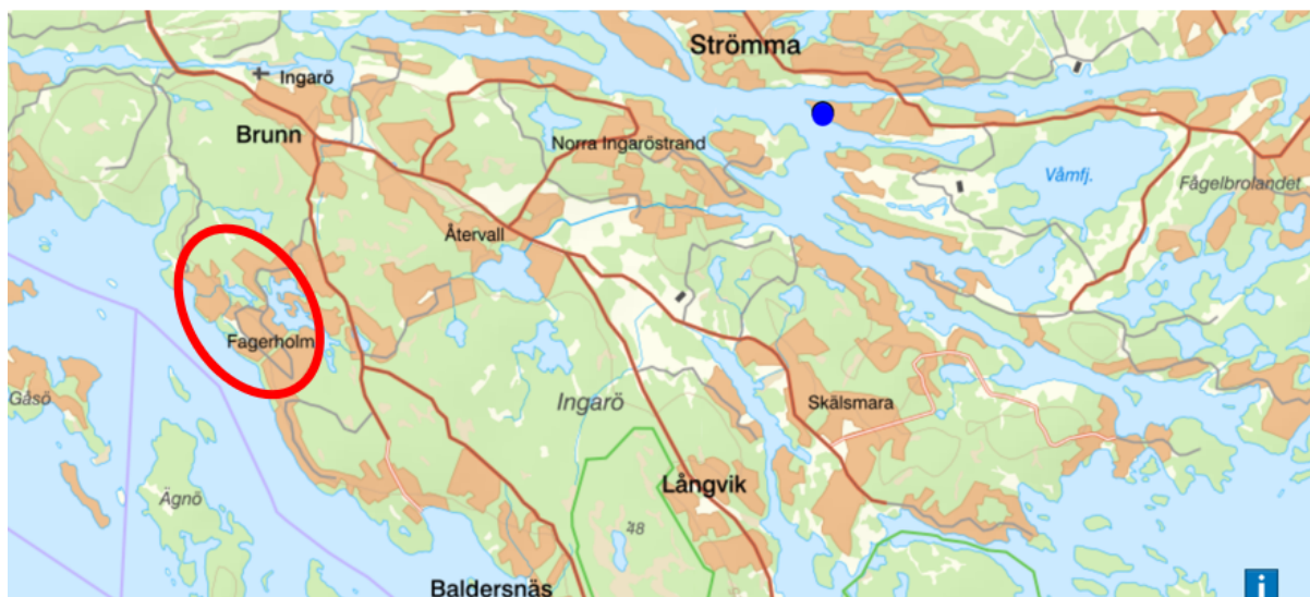
Karta: PFO-området Fagerholm på Ingarö ligger cirka två km söder om Brunn.

Planläggning och utbyggnad av kommunalt VA kan då skjutas upp under 10–15 år. Det är därför möjligt att upphäva detaljplanen bp5. Detaljplanens upphävande bedöms kunna antas av kommunfullmäktige under kvartal 2 2023.