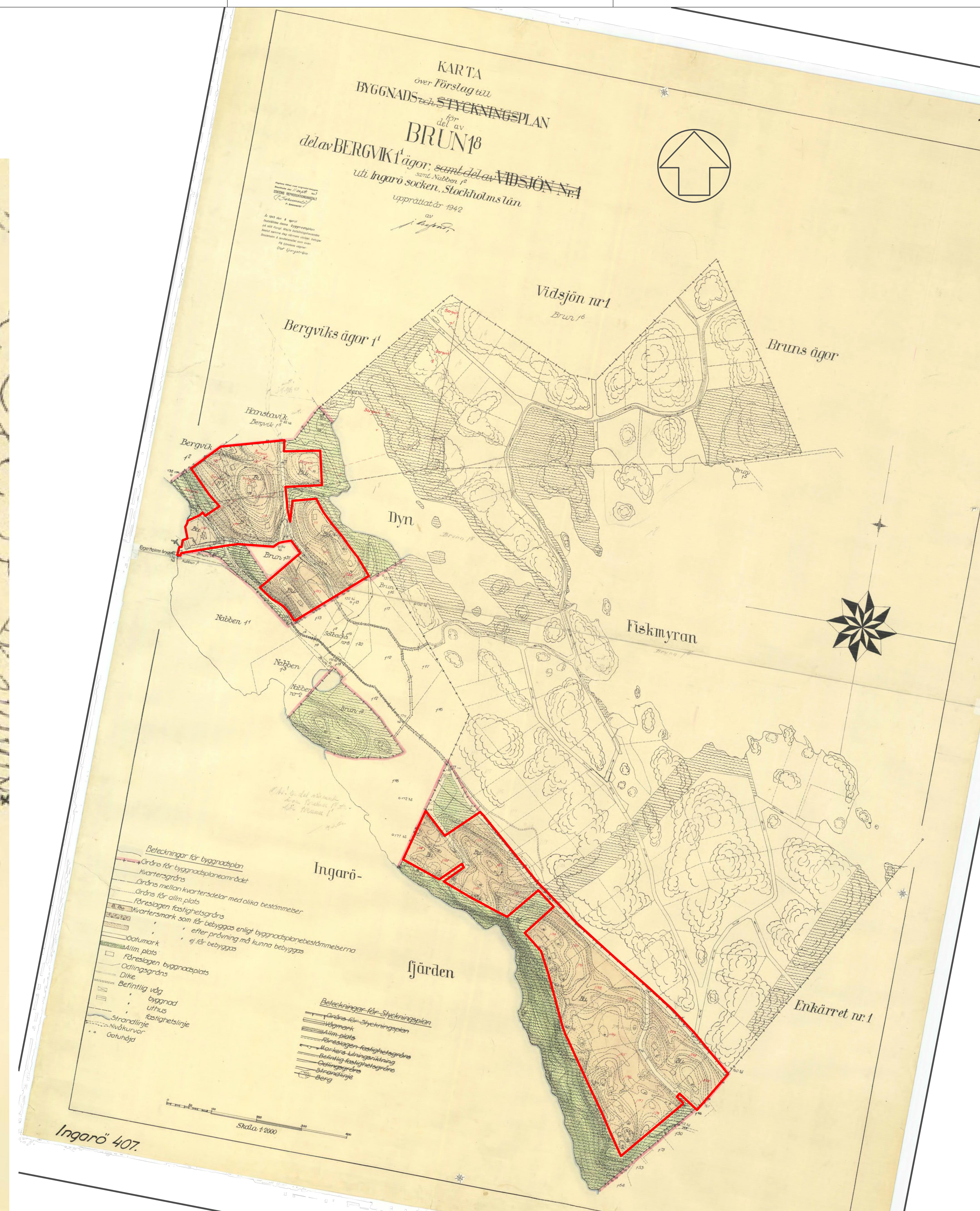
Del av byggnadsplan 5, plankarta med byggnadsplan södra delen