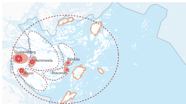
Livet i Värmdö ska utvecklas kring centralort, serviceorter och kärnor.

Värmdö ska utvecklas efter närsamhällets principer. Det ska vara lätt att skapa gemenskap och nätverk. Närhet till skolor, affärer, bussar, natur och lekplatser är viktigt.