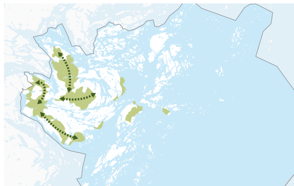
Gröna kilar, stråk och skärgården är basen i grönstrukturen.

Alla som bor i Värmdö ska ha nära till natur och bad. Gröna kilar och stråk ska bevaras och utvecklas. Sjöar, kustvatten och skärgård är basen i ett rikt rörligt friluftsliv.